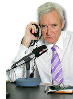
Luis del Olmo